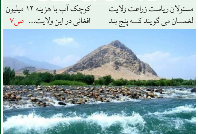
مستولان ریاست زراعت ولایت لغمان می گویند که پنج بند کوچک آب با هزینه ۱۲ میلیون افغانی در این ولایت ... ص ۷