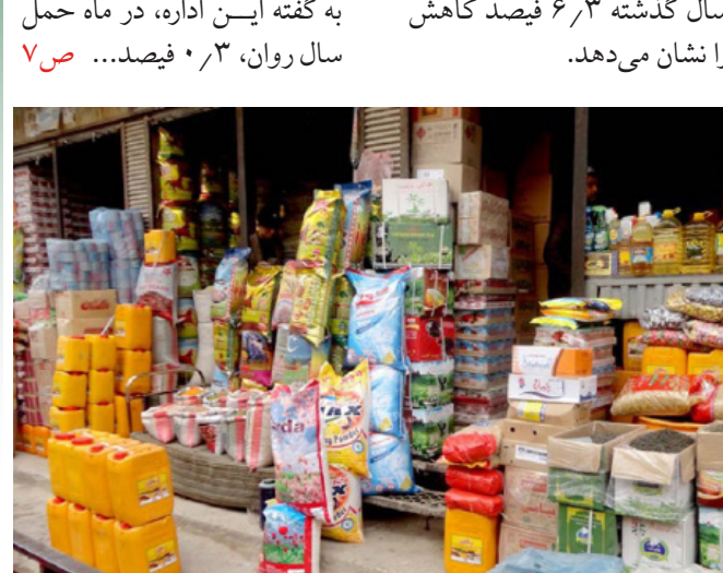
به گفته این اداره، در ماه حمل سال روان، ۰٫۳ فیصد ... ص ۷

سال گذشته ۶٫۳ فیصد کاهش را نشان می‌دهد. اداره ملی احصائیه و معلومات می‌گوید، تورم ماهانه شاخص قیمت مواد مصرفی در ماه حمل سال روان ۰٫۹ فیصد افزایش را نشان می‌دهد، این افزایش بیش‌تر به دلیل بلند رفتن شاخص قیمت مواد خوراکی (روغن، سبزی‌جات و مصالحه‌جات) و مواد غیر خوراکی (البسه‌باب و وسایل خانه) می‌باشد. این اداره گفته‌است، هم‌چنان تورم نقطه به نقطه ماه حمل سال ۱۴۰۳ در مقایسه به همین ماه در