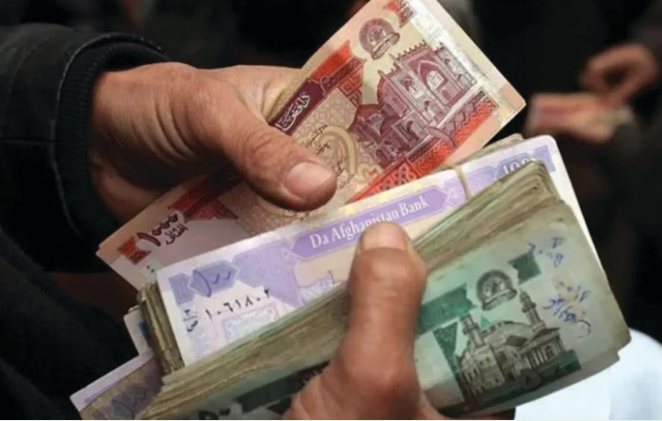
انیس: صبورفرزان سیغانی سخنگوی مقام ولایت بامیان به خبرنگار روزنامه ملی انیس گفت که همزمان با فرارسیدن عید سعید فطر، دفتر مرجعیت آیت الله

محمد اسحاق فیاض در مرکز ولایت بامیان طی مراسمی با حضور داشت والی ولایت بامیان، رئیس شهدا و معلولین و جمعی از علما در مدرسه مهدیه فولادی، برای ۲۰۶۹ کودک یتیم پول نقد و مواد خوراکی توزیع نمود. به گفته‌ی وی عبدالله سرحدی، والی ولایت بامیان که در جمع علما، مسئولین، خانواده‌های شهدا و ایتم صحبت می‌کرد از مساعدت‌های همیشگی دفاتر و به خصوص دفتر آیت الله فیاض در بامیان قدر دانی نموده و گفت: رهبری اداره محلی بامیان از برنامه‌های مفید دفاتر آیات عظام در راستای حمایت از محرومین، خانواده‌های... ص ۳