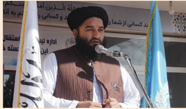
در نه ولسوالی ولایت بلخ بازسازی و ساخت و ساز