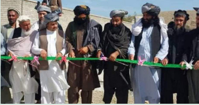
ریاست احیاء و انکشاف دهات ننگرهار می‌گوید که ۵۲۱ پروژه انکشافی با هزینه ۷۰۳ میلیون افغانی به کمک مالی اداره پوینس

در ولسوالی‌های پچیراگام، رودات، مومندره و کوت این ولایت تطبیق شده است. به گفته مسئولان ریاست احیاء و انکشاف دهات ننگرهار، این پروژه‌ها، شامل اعمار و جغل اندازی سرک‌ها، ساخت دیوارهای استنادی، پلچک‌ها، پاک‌کاری و کانکریتریزی کانال‌های آب، تمديد شبکه‌های برق‌رسانی و اعمار بندهای... ص ۴