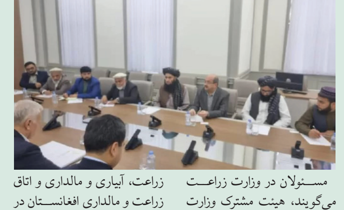
مسئولان در وزارت زراعت می گویند، هیئت مشترک وزارت زراعت، آبیاری و مالداري و اتاق تجارت و صنایع اوزبیکستان در

جریان سفرشان به اوزبیکستان با مسئولان اتاق تجارت و صنایع آن کشور دیدار کردند. در این دیدار مولوی صدراعظم عثمانی از افزایش صادرات محصولات زراعتی افغانستان به کشور اوزبیکستان سخن زده افزود؛ افغانستان و اوزبیکستان دو کشور همسایه و دارای منافع مشترک است و ما هم می خواهیم که صادرات محصولات... ص ۴