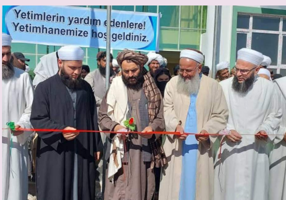
مسئولان محلی در ولایت غزنی می گویند که کار ساخت یک یتیم خانه در ولسوالی اندر این ولایت با هزینه ۱۸۰ هزار دالر امریکایی تکمیل و به بهره برداری سپرده شده است.