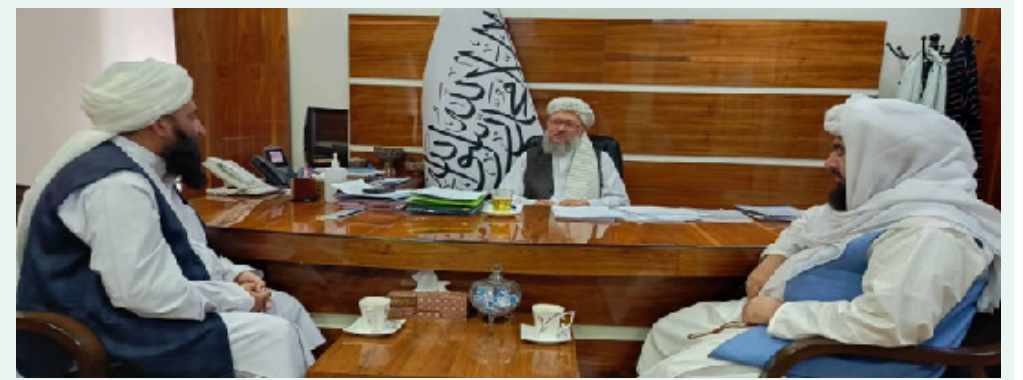
مولوی عبدالسلام حنفی، معاون اداری ریاست الوزرا امارت اسلامی کارکردها و فعالیت های وزارت ارشاد، حج و اوقاف را ستود. دفتر مطبوعاتی این معاونیت،

در خبرنامه یی نوشته است: مولوی حنفی در دیدار با شیخ زر محمد حقانی، معین مسلکی وزارت ارشاد، حج و اوقاف گفت: مسئولان این وزارت تلاش کنند تا از این پس نیز خدمات بهتر را به حجاج، به بهترین شکل ممکن ارائه دهند و هم چنان در امر خدمت رسانی برای شهروندان کشور نیز تلاش کنند. شیخ زر محمد حقانی، معین مسلکی