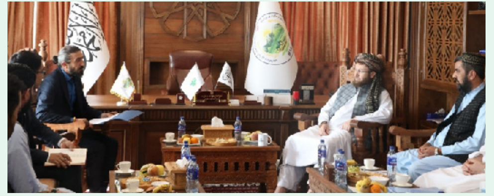
سرپرست وزارت زراعت و آبیاری و مالداري در دیدار با رئیس آژانس انسجام و همکاری جمهوری ترکیه، تیکا، خواستار همکاری این نهاد در تطبیق پروژههای

زیربنای در بخش زراعت، آبیاری و مالداري در افغانستان دیدار کرد. در این دیدار رئیس دفتر