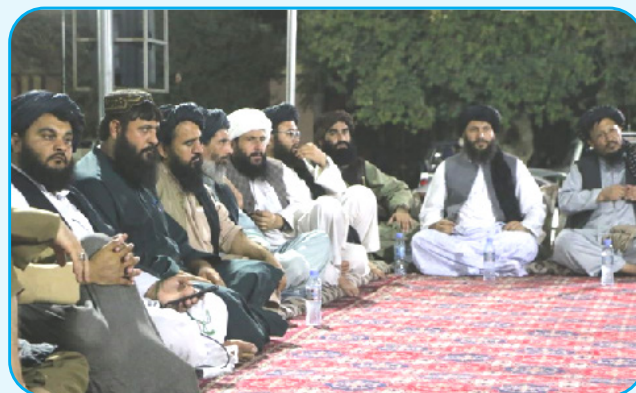
رئیس اطلاعات و فرهنگ جوزجان گفت که هدف از راه اندازی این برنامه ایجاد همبستگی، اتحاد ۴ ص

ریاست اطلاعات و فرهنگ جوزجان، مشاعره ادبی برای همبستگی میان اقوام کشور راه اندازی کرد. به گزارش آژانس باخت؛ این مشاعره با اشتراک مسئولان محلی و مجاهدان جوزجان و هم چنان شماری از علما و مجاهدان کابل، مزار شریف، قندهار و هلمند در شهر شبرغان راه اندازی شد. مولوی سیف الدین معتصم،