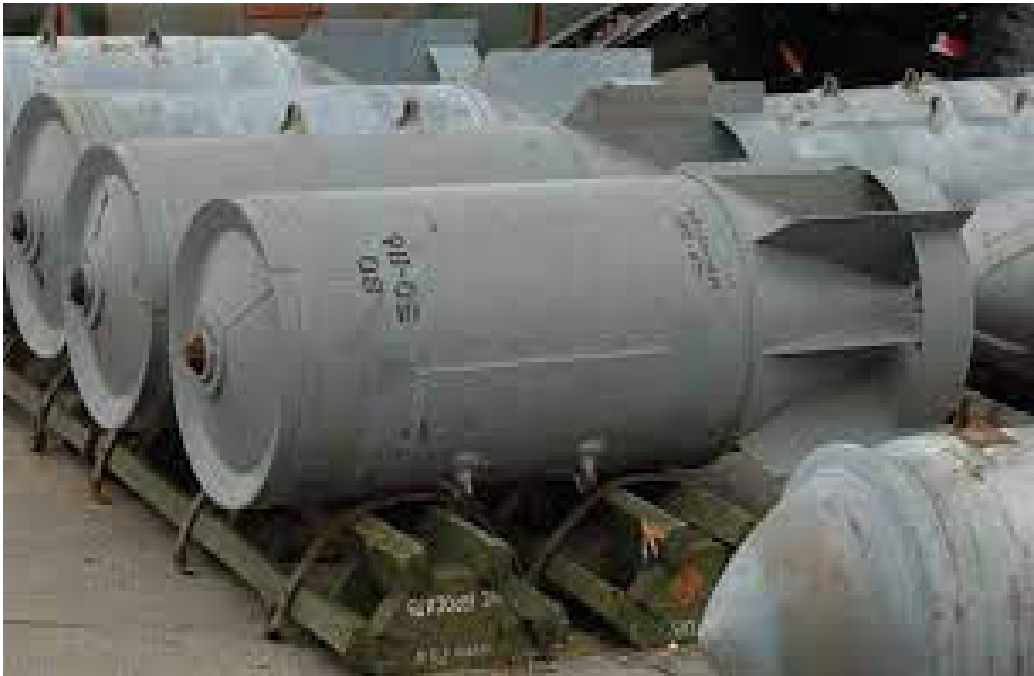
۲۶۰ ميليونه خوشه يي مهمات په لاس هېواد وغورځول چې په زرگونو کسان يې له امله ووژل شول او لا هم تر خاورو لاندې وکاروي. دا ډول وسلې پراخې کييف ته خوشه يي بمونه انتقال کړي تر څو يې د اوکراين پوځ د روسيې پرضد په جگړه کې وکاروي. دا ډول وسلې پراخې

هېوادونو دا وسله وکاروله چې برتانيا، امریکا، هالنډ، اسراییل، مراکش، فرانسه، اریتره، ایتوپیا هېوادونه پکې شامل دي. امریکا د ۱۹۶۴ څخه تر ۱۹۷۳ پورې پټ دي. اوس تازه بیا د کلسټر بمونو يا خوشه يي بمونو خبره له مودو وروسته بیا هغه وخت راپورته شوه چې سپینه ماڼۍ غواړي اوس تازه بیا د کلسټر بمونو يا خوشه يي بمونو خبره له مودو وروسته بیا هغه وخت راپورته شوه چې سپینه ماڼۍ غواړي