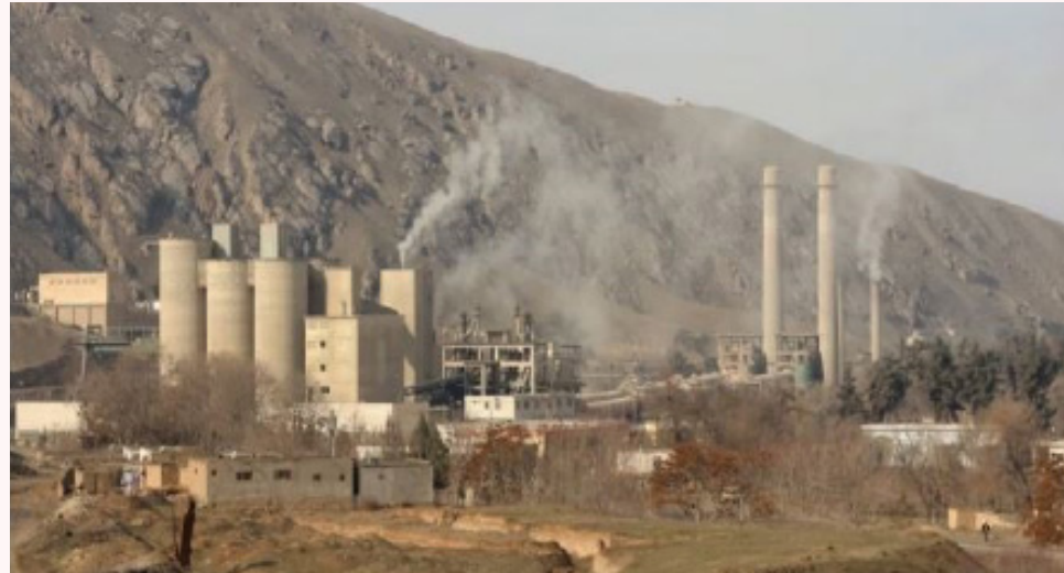
در زمان حکومت سابق هم برای اعمار فابریکه سمنت شرکت های داوطلب آغاز ارزیابی پروپوزل ها و اسناد کند.

فابریکه سمنت جبل السراج در سال ۱۳۳۷ هجری شمسی با ماشینری و دستگاه های اساسی کشور وقت چکوسلوواکیا و با ظرفیت تولیدی روزانه صد تن سمنت ساخته شده بود که نیازمندی آن زمان در سطح کشور را مرفوع می ساخت.