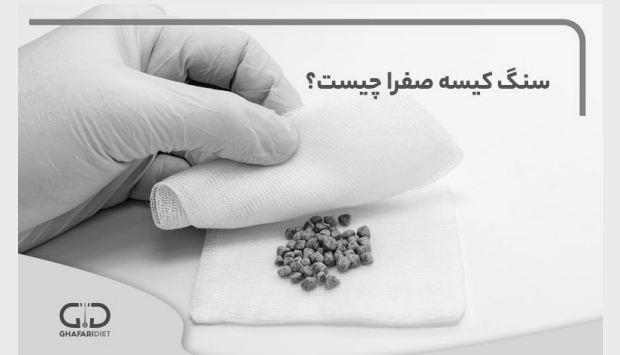
سنگ کیسه صفرا چیست؟

صفرا یا زردک مایعی است که توسط کبد تولید می شود و در کیسه صفرا ذخیره می شود. صفرا برای هضم و جذب چربی ها در روده لازم است. این مایع دارای رنگ زرد تا سبز روشن است و ترکیباتی مانند صفراکارتین، کلسترول، سلول های قرمز خون و نمک های معدنی را شامل می شود. سنگ هایی که در این کیسه یا مجاری صفراوی تشکیل می شوند می توانند علائمی مانند درد شدید شکمی، تهوع، استفراغ، تغییر رنگ ادرار و مدفوع و آسیب به کیسه را ایجاد کنند.