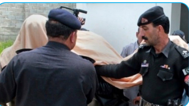
د پاکستان د پولیسو چارواکي وايي چې په پلازمېنه اسلام اباد کې یې نژدې ۵۰۰ افغان پناه غوښتونکي نیولي دي. ۴مخ

د پاکستان د پولیسو چارواکي وايي چې په پلازمېنه اسلام اباد کې یې نژدې ۵۰۰ افغان پناه غوښتونکي نیولي دي.