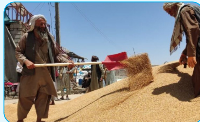
دهقانان در ولسوالی نهرسراج روان، به دلیل کاهش بهای گندم، هلمند، می گویند که در سال نمی‌توانند آن چه را در حاصلات ۴ص

گندم هزینه کرده اند، به دست بیاورند. گران، دهقانان در ولسوالی نهرسراج، با شکایت از پایین آمدن بهای گندم، می گویند که این روزها برای تأمین نیازهای خانواده اش، حیران است. او می گویند که همه وسایل دهقانی را به کرایه گرفته بود و اکنون به دلیل بهای پایین گندم، مفاد نصیبش نمی‌شود و مجبور است برای کارگری به ایران یا ولایت‌های دیگر برود. ۴ص