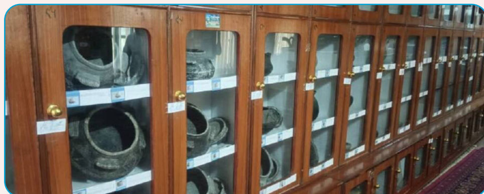
تړېدو سره ښايي دغه اثار ختم شي يا وراسته شي؛ ځکه ځای يې مناسب نه دی. بايد مناسبې الماری ولري، پراخ ځای وي، تر څو دغه اثار په ښه ډول وساتل شي. ۴مخ

د خوست یوشمېر فرهنگپالان او اوسېدونکي اندېښنه ښيي چې په دغه ولایت کې د موزیم شاوخوا ۵۰۰ تاریخي او فرهنگي اثار د اطلاعاتو او فرهنگ ریاست په یوه کوټه کې ساتل کېږي چې د خلکو د لاسوهنې له امله د خرابېدو یا ورکېدو له گواښ سره مخامخ دي. دوی وايي، تاریخي او فرهنگي اثار د یوه هېواد د تېر تاریخ ښکارندويي کوي او په کار ده چې د خوست تاریخي اثارو