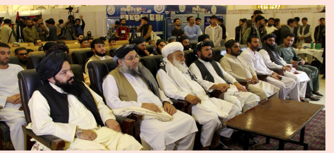
۱۸۰ غرفه به نمایش گذشته شده است. در مراسم افتتاح این نمایشگاه مولوی سعد الدین سعید معین مالی، اداری و گرجندوی وزارت اطلاعات و فرهنگ، در صحبت هایش برگزاری چنین نمایشگاه ها را در رشد صنایع و تولیدات داخلی و تشویق صفحه ۴

مسئولان وزارت اطلاعات و فرهنگ، صنعت و تجارت و اقتصاد، دیروز نمایشگاه «اختر بازار» را در تالار خلیج واقع سرک هشتاد متره میدان هوایی کابل، افتتاح کردند. به گزارش خبرنگار آژانس باخت؛ در این نمایشگاه محصولات صنایع مختلف داخلی کشور در