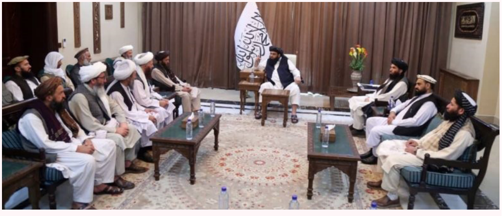
د ریاست الوزرا سیاسي مرستیال او کفیل مولوي عبدالکبير پرون د بغلان ولایت له یو شمېر دیني عالمانو او قومي مخورو سره په سپېدار مانۍ کې وکتل. یادو دیني عالمانو او مشرانو د

اسلامي امارت پر بيا واکمنېدو خوښې څرگنده کړه او ويي ويل چې د اسلامي نظام په بيا واکمنۍ سره په ټول هېواد کې د سولې او پرمختګ ټغر غوړېدلی دی. دوی همدارنګه زیاته کړه، چې د هېواد آبادي غواړي او د همدې موخې لپاره ولسونه هم له حکومت سره همکاري ته لېواله دي. یادو مشرانو او دیني عالمانو په بېلابېلو برخو کې د یاد ولایت د خلکو د ستونزو د حل په موخه عریضې د ریاست الوزرا له مقام سره شریکې کړې. په ورته وخت کې د ریاست الوزرا سیاسي مرستیال او کفیل په دغه کتنه کې وویل چې اسلامي امارت د هېواد بیارغونه خپل مسئولیت کني او همدې موخې ته د رسېدو لپاره شپه او ورځ کار روان دی. نوموړي زیاته کړه، چې اسلامي امارت به د ټولو قومونو غوښتنو ته رسیدګي وکړي او د شته امکاناتو پر مټ به یې ستونزې حل کړي.