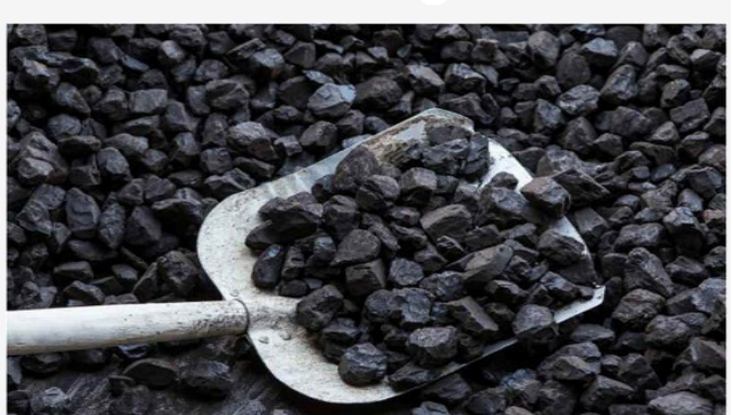
پاکستاني رسنی د افغانستان د کانونو او پترولیم وزارت په قول وایي چې پاکستان ته یې د سکرو بیه او پر صادراتو گمرکي محصول کم کړی دی. ایکسپریس تریبون ورځپاڼې پرون په دې اړه په یوه راپور کې ویلي چې د اسلامي امارت دا پرېکړه د پاکستان په شمالي سیمو کې د سمینتو د فابریکو لپاره بڼه

مسئولان محلی در تخار می گویند از میان ۵۲ آبنده تاریخی و ساحات باستانی در این ولایت، دو آبنده در معرض نابودی قرار دارد. به گفته آنان، مسجد حضرت واقف و زیارت شیخ خلیل الله ولی نمونه بیش از ۵۰ آبنده تاریخی در تخار اند که اگر بازسازی نشوند، تخریب خواهند شد.