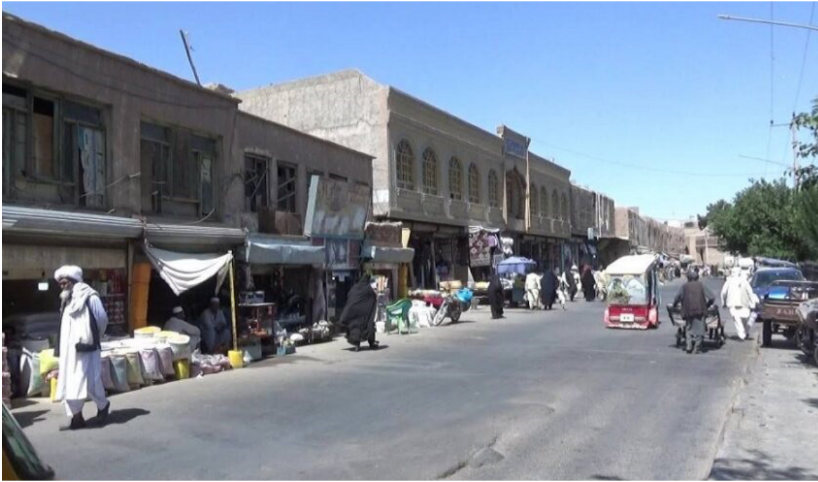
شهر قدیم را بگیرد.

صفا گفت: «امیدوار هستیم که معیارات لایحه حفظ شهر قدیم هرات رعایت شود، ضرر این نه تنها به آبدات تاریخی بلکه به تمام هرات و افغانستان می‌رسد و ما از ثبت در فهرست میراث‌های جهانی، باز می‌مانیم که یک جفا به حق هرات، افغانستان و قاره آسیا