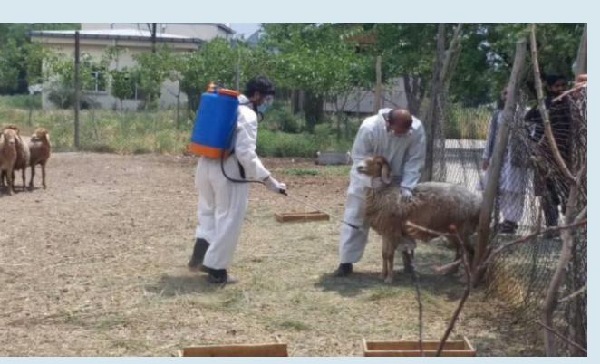
تب خونریزی دهنده کانگو، یک بیماری ویروسی و کشنده است که از طریق گزیدن کنه داخل بدن حیوان شده و پس از آن، از طریق تماس یا خوردن گوشت آن، به انسان انتقال می یابد. صدراعظم عثمانی، معین وزارت زراعت، آبیاری و مالداري، در یک نشست خبری که دیروز (یکشنبه، ۲۸ جوزا)، در مرکز اطلاعات و رسانه های صفحه ۴

تپل دی او تمه کېږي چې له دې کبله به د سمینتو پر صنعت فشار کم شي. ورځپاڼې د افغانستان د کانونو او پترولیم وزارت پر اساس ویلي چې په نړۍ کې د سکرو د بیه د کمېدو له کبله د افغانستان حکومت پرېکړه کړې چې د هر تن سکرو بیه ۵ ډالره او د هر تن سکرو گمرکي محصول ۴ مخ