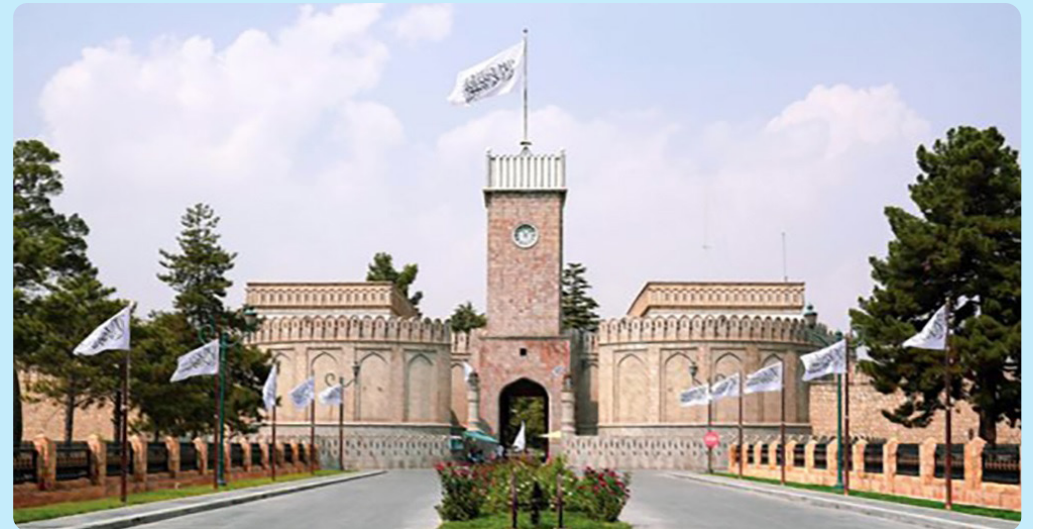
کمیسیون سیاسی امارت اسلامی، یکبار دیگر تاکید کرده است که امارت اسلامی روابط خوبی با کشورهای همسایه دارد. بر اساس یک اعلامیه ارگ، در جلسه این کمیسیون که شام

شنبه (۱۳ جوزا)، به ریاست مولوی عبدالکبیر، معاون سیاسی و کفیل ریاست الوزرا برگزار گردید، در مورد برخی موضوعات مهم سیاسی و روابط افغانستان با کشورهای همسایه بحث شد. اعضای کمیسیون سیاسی تاکید دارند که امارت اسلامی موضوعات قابل بحث را از طریق گفت و گو حل می کند. این در حالی است که اخیرا موضوع حقایق دریای هلمند باعث تنش میان افغانستان و ایران شده بود، اما پس از مذاکرات میان مقام های دو طرف، این تنش ها تا حد زیادی کاهش یافته است.