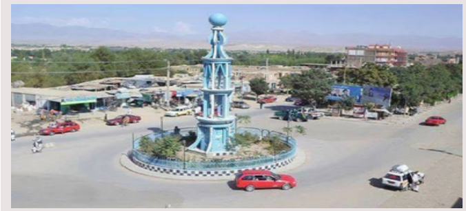
تنه اوسېدونکو ته د دغه ولسوالۍ په ۱۵۰۰ تنو ته د کار زمینه برابره شوې ده.

د لوگر د کلیو او پراختیا ریاست مسولین وایی، چې د دې ولایت په خوښی ولسوالۍ کې د څو پروژو له لارې ۱۵۰۰ تنو ته د کار زمینه برابره شوې ده. د لوگر د کلیو او پراختیا ریاست مطبوعاتي مسؤل باختر آژانس ته وویل؛ د خوږو نړیوال سازمان په مالي ملاتړ د (asset creation) او (RUPANI) برنامو موسسو لخوا د خوښی ولسوالۍ ۱۵۰۰