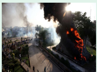
پښتونخوا کې قهرجنو پلویانو په سوات او پېښور کې خدماتي ادارې خرابوي.

د پاکستان پخوانی لومړی وزیر عمران خان تر نیول کېدا وروسته د اسلام آباد پولیسو مشر په بیان کې وپېلې چې خان د «القادر ترست» قضیه کې نیول شوی دی. په اسلام کې ۱۴۴ بند نافذ شوی او پولیس وايي که څوک سرغړونه وکړي، پر خلاف به یې کام واخلستل شي، خو په پاکستان کې سخت کرکېچ لا منخته شوی او په ځینو ښارونو کې انټرنېټ بند شوی دی. د عمران خان په پلوی