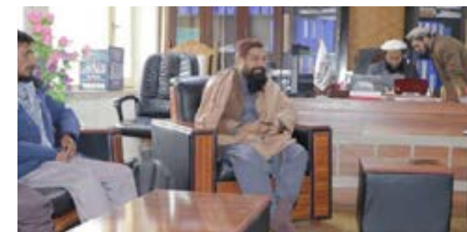
یادی لری د پیل په موخه تاکل شوي پلاوي پرون خپله لومړنی ناسته د نورستان ولایت ۴ مخ

د عالیقدر امیرالمؤمنین حفظه الله د فرمان سره سم د سوالگرو د راتولولو کمپسیون د جوړولو او