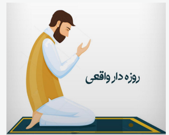
روزه دار واقعی

به ویژه هنگامی که از عبودیت نفس، خواهشات و از بندگی بطن، فرج و شهوت، پشت کرده است، اینگونه عبودیت در فضای ایمان کامل انجام می شود، چون مؤمن کامل کسی است که