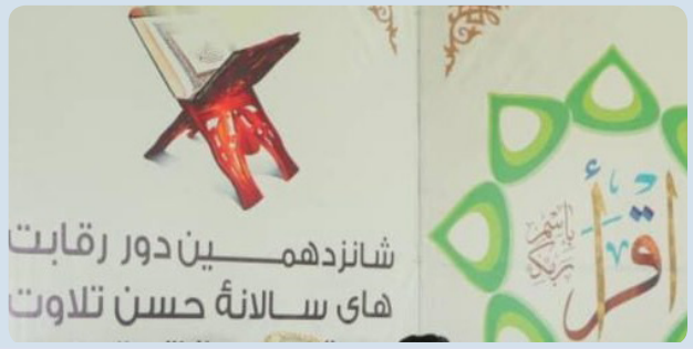
شانزدهمین دور رقابت های سالانه حسن تلاوت

به مرحله‌ی بعدی (در مرکز کشور) انتخاب شونده. به تعداد ۱۰۰ تن از زون شمال در بلخ صفحه ۷